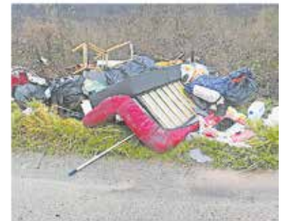
Der Müllberg zwischen Oberbillig und Wasserliesch ist inzwischen weg.

OBERBILLIG/WASSERLIESCH (cmk) Das Bild von der Stelle verbreitete sich rasend schnell mit vielen wütenden Kommentaren auf Facebook. Auch die Polizei wurde schnell aktiv. Die Kripo Trier habe den mutmaßlichen Täter, der den Abfall dort entsorgt hat, gefunden, heißt es auf TV-Anfrage bei der Pressestelle des Polizeipräsidiums Trier. Der Fall sei in Saarburg angezeigt worden, am Montag sei ein Tatverdächtiger ermittelt worden. Am Dienstag habe die Polizei den Verdächtigen kontaktiert, der einen Autoanhänger voller Sperrmüll und anderen Abfällen entsorgt haben soll. Bis vor kurzem habe der mutmaßliche Umweltsünder einen Gewerbebetrieb im Industriegebiet Konz-Könen betrieben, sagt Polizeipressesprecher Karl-Peter Jochem. Er habe den Müll noch am Tag der Kontaktaufnahme durch die Polizei unter Aufsicht der Beamten beseitigt. „Jetzt sieht die Stelle wieder picobello aus“, sagt Jochem. Dennoch wird gegen den Mann wegen unerlaubtem Umgangs mit Abfällen ermittelt. Dabei geht es um unsachgemäßen Umgang mit gefährlichen Abfällen, die giftig, explosiv oder krankheitserregend sind.